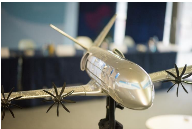
Abb. 2 So stellen sich die BTU und chesco ein künftiges hybridelektrisches Flugzeug vor