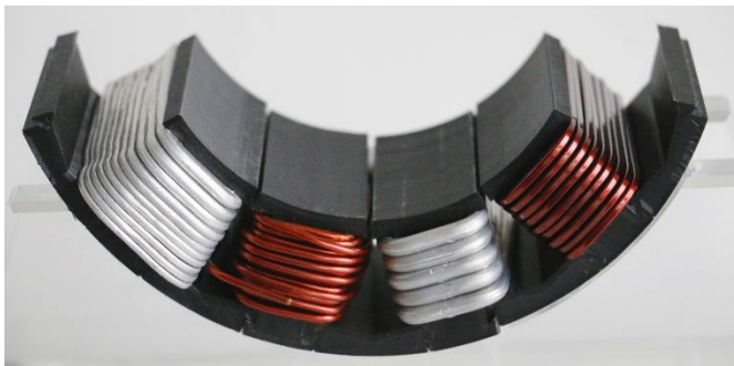
Abb. 3 Beispiele verschiedener Draht- und Windungsgeometrien in einer Zahnschleife: Nur die flexible, lageangepasste Geometrie (links) nutzt den Bauraum weitgehend aus