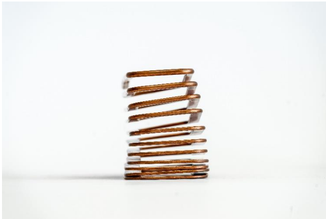
Abb. 2 Trapezförmige Demonstratorspule mit lageangepasster Draht- und Windungsgeometrie